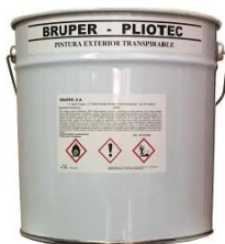
Envase metálico Producto al disolvente